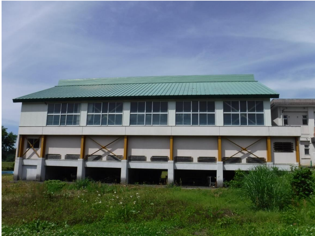
旧東下組小学校 体育館（令和5年6月撮影）