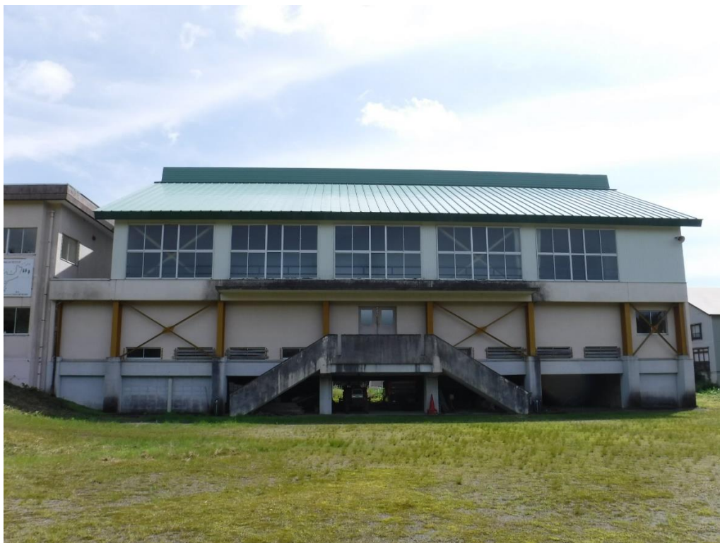
旧東下組小学校 体育館（令和5年6月撮影）