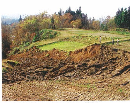
農地も地震で大きな被害を受けた(下条)