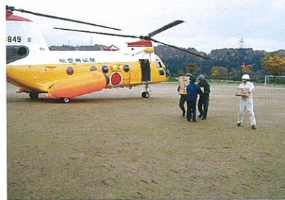
自衛隊のヘリコプターから救援物資を運び出す