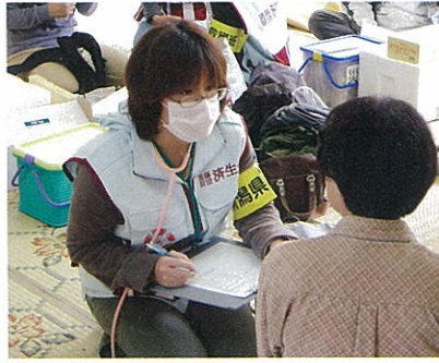
住民に声をかけ、健康状態を気遣う応援の保健師