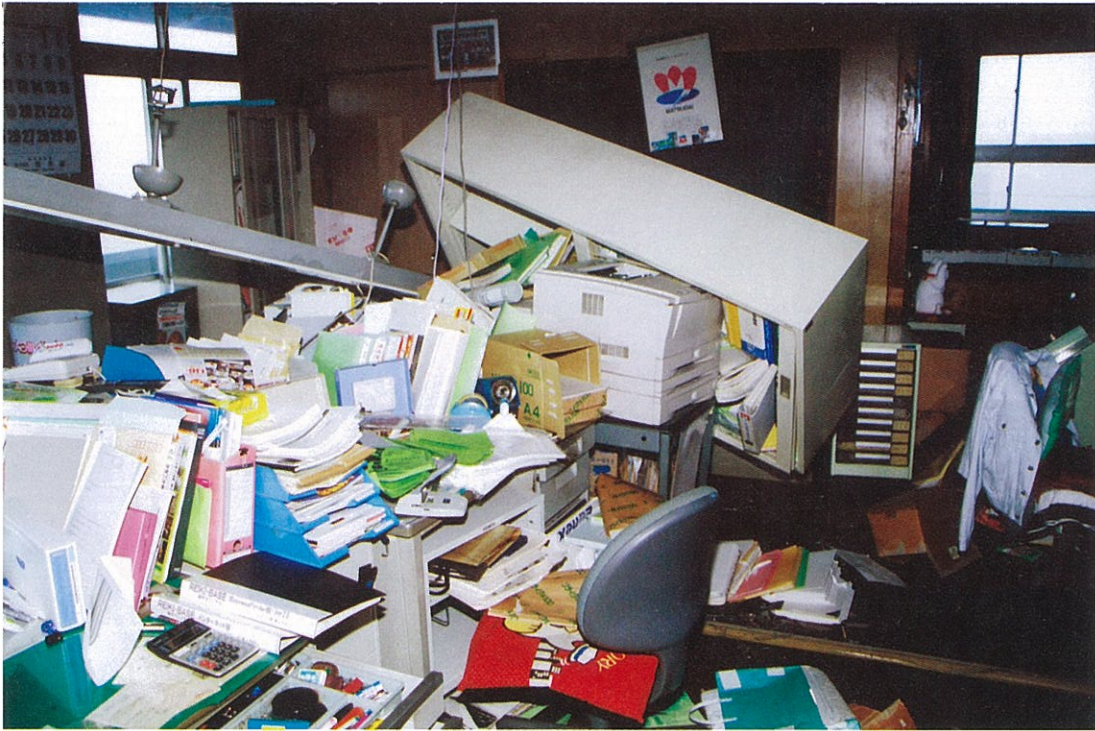
たび重なる大きな余震で旧松代町役場の中はめちゃめちゃに