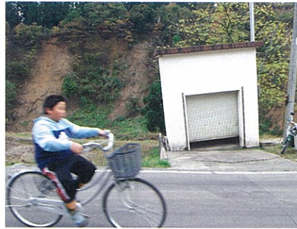
地震で傾いた下水道のポンプ小屋