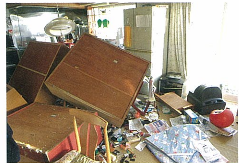
ひっくり返った食器棚やテレビが衝撃の強さを物語る