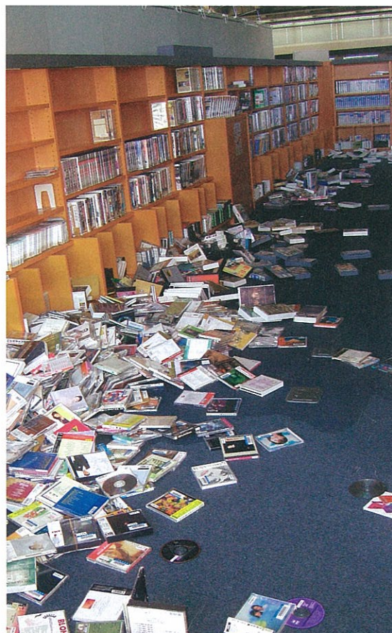
大きな揺れでスプリンクラーが破損し、全館水浸しとなった十日町情報館。水にぬれたために廃棄処分された図書資料は約7,000冊に及んだ