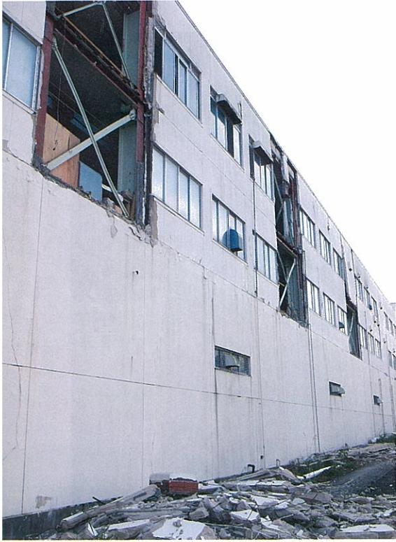
壁が崩れ落ちた工場