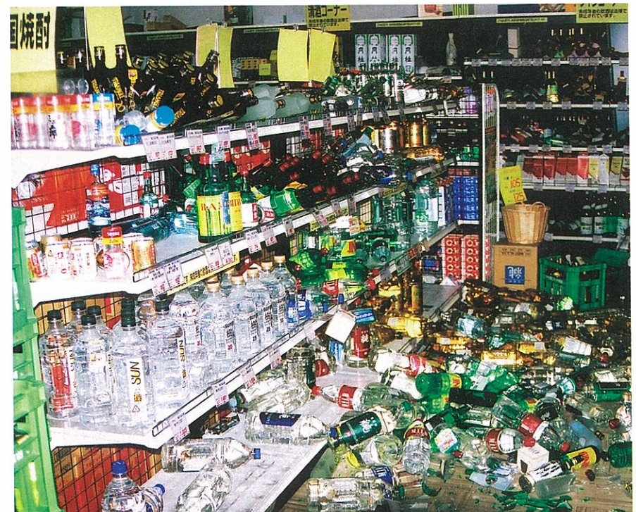
酒店では大量のボトルが落ちて割れた