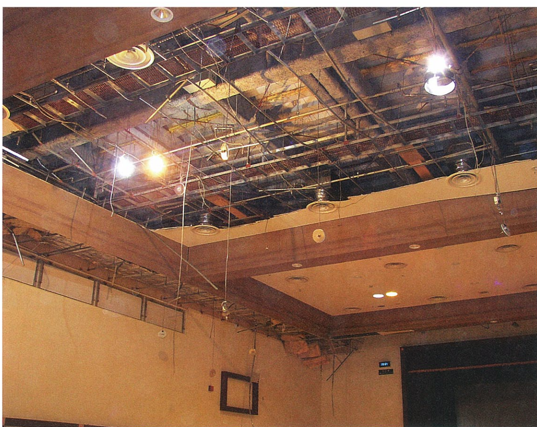
天井材や照明のほとんどが落ちてしまった中里ユーモール