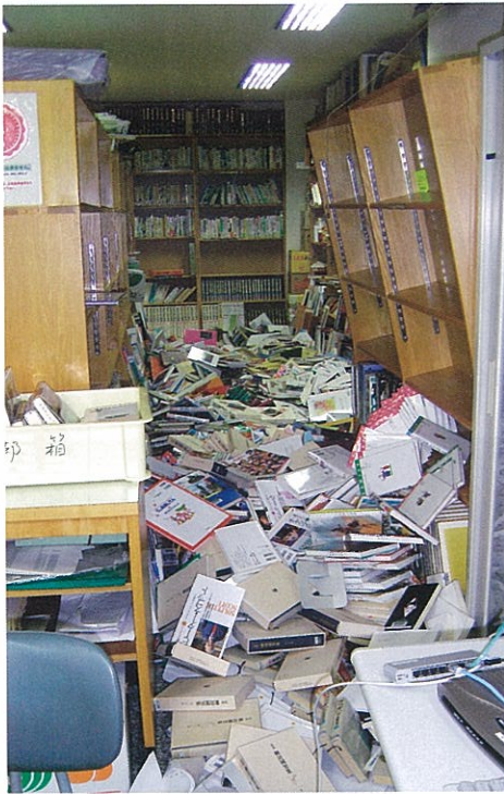
落ちた蔵書が通路を埋め尽くした(公民館図書室)