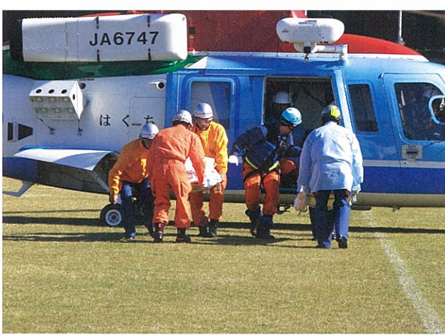
救急患者を運ぶ新潟県防災ヘリコプター