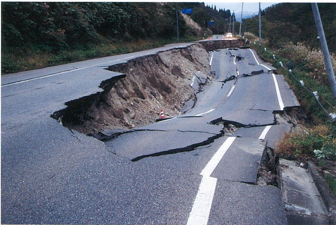
国道252号は大きく崩落し、通行止めとなった