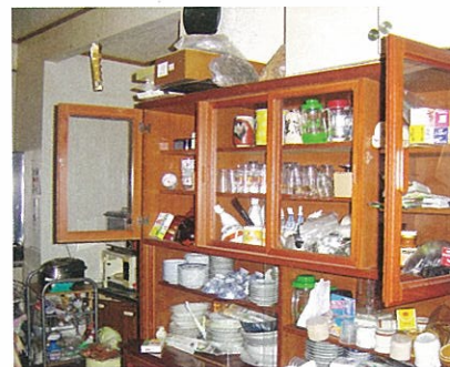
激しい揺れにとびらが開き、中の物が落下