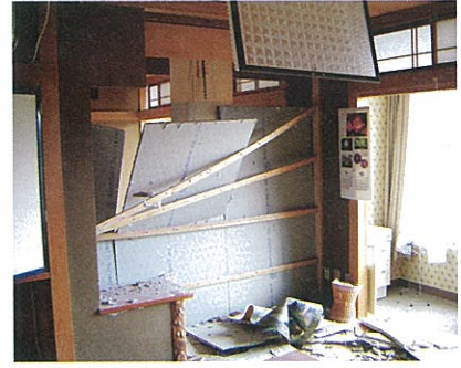
隣の部屋が見えるほど壁板が落ちた松葉荘