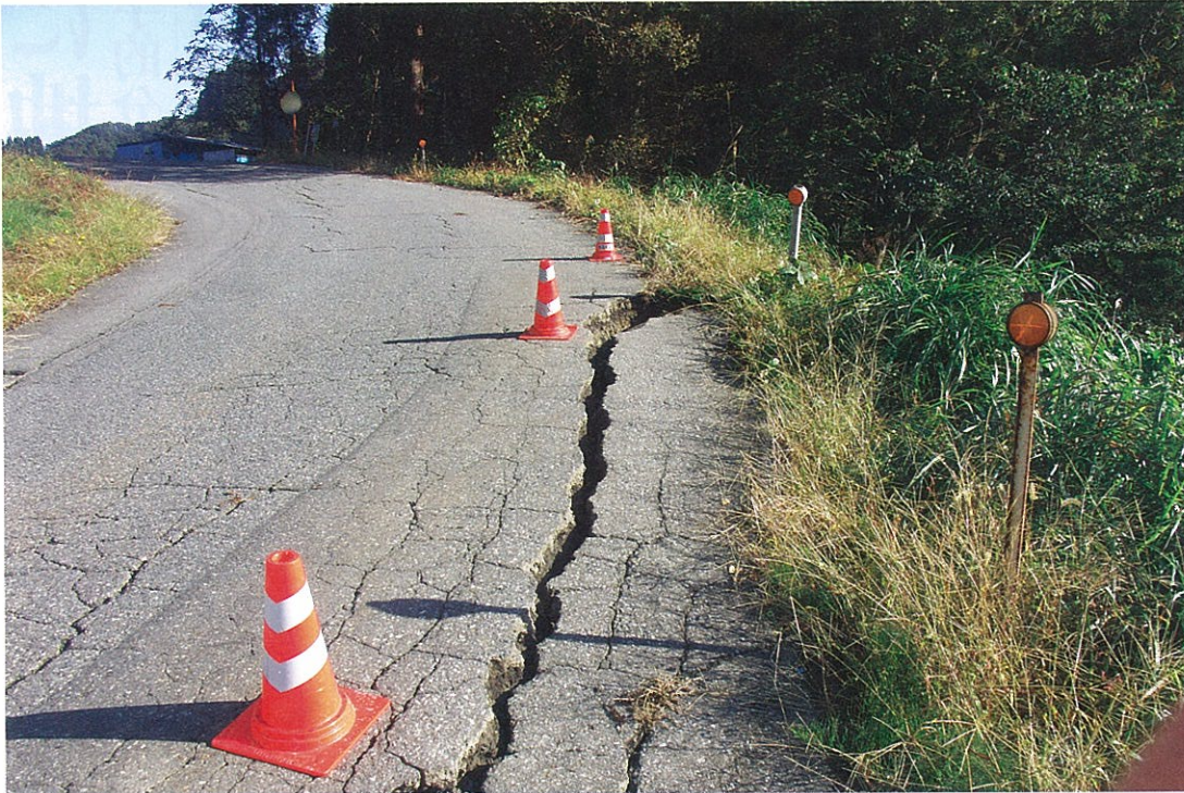
道路に入ったき裂