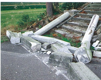
神社の鳥居もばったりと倒れ、割れてしまった