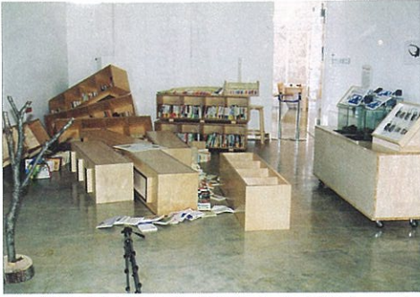
重い本棚が飛び上がるほどの衝撃だった(森の学校キョロ口)