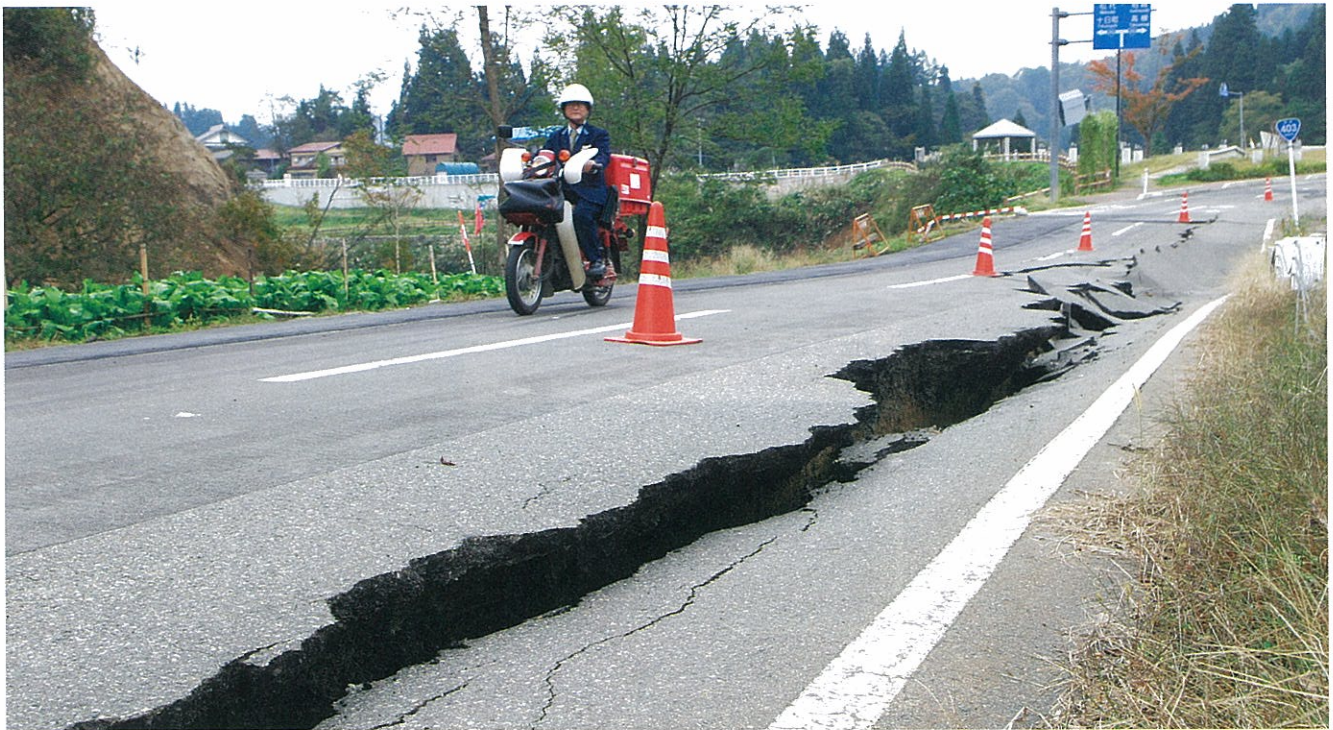
大きな地割れができた国道403号。それでも郵便は配達された(赤谷)