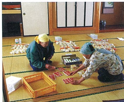
救援物資は集落の各世帯に平等に分配