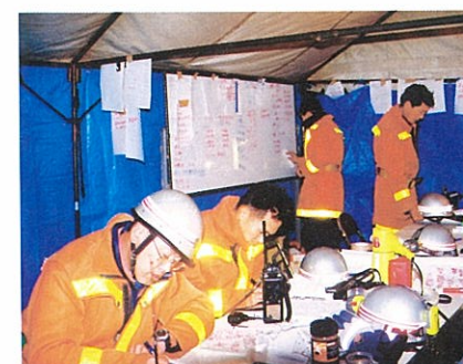
被害確認・救急の最前線となった消防本部