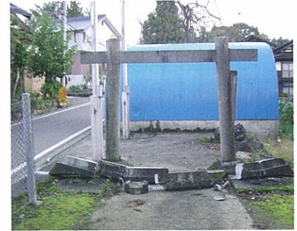
崩れ落ちた天神様の鳥居