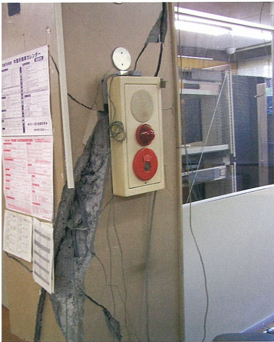
柱にき裂が入り、ずれて中の鉄筋がむき出しになった(旧中里村役場)