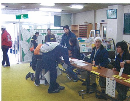
県内外から多数のボランティアが駆け付けた