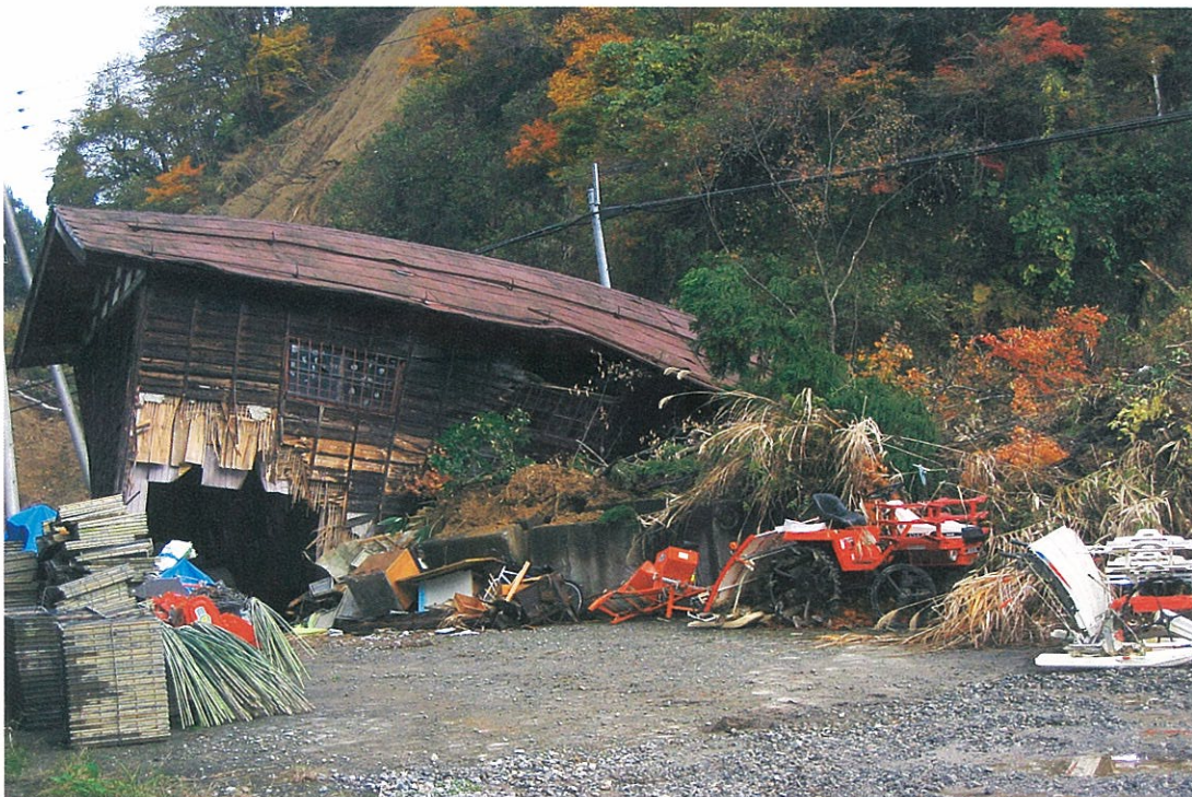
地震の衝撃で1階部分がつぶれ、大きく傾いた建物(ニツ屋)