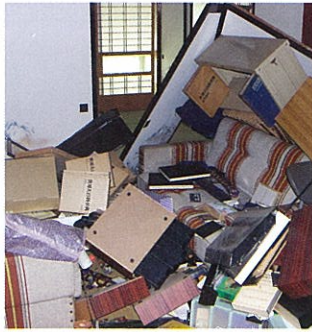
ふすまが外れ、たんすもひっくり返った