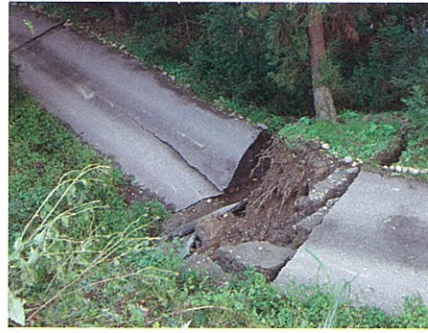
真っ二つに割れ、高い段差ができた道路