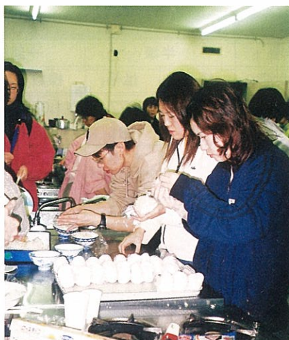
炊き出し用おにぎりを握る市職員