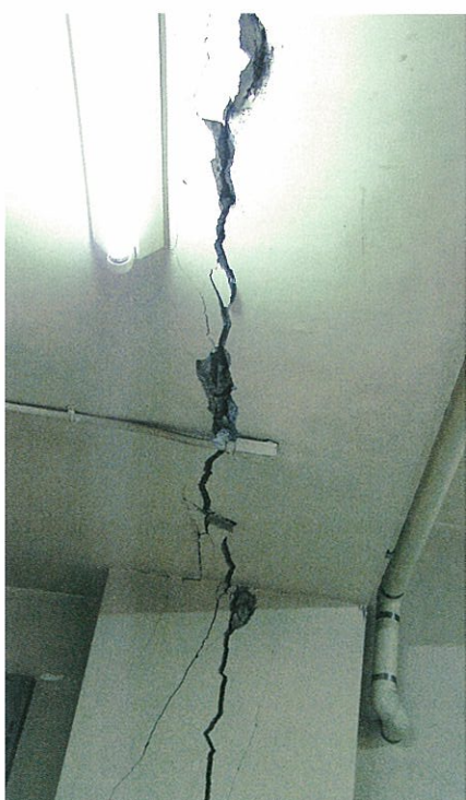
天井から柱にかけて大きなき裂が入った(旧中里村役場)