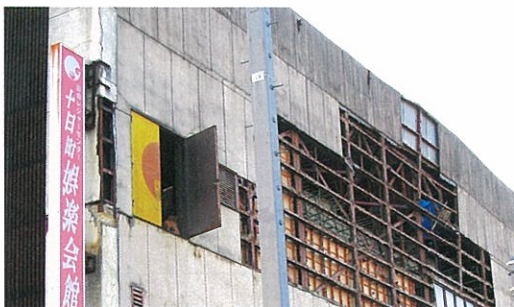
外の壁板が落下した娯楽会館。落下した壁が人を直撃し、十日町市で最初の犠牲者を出した