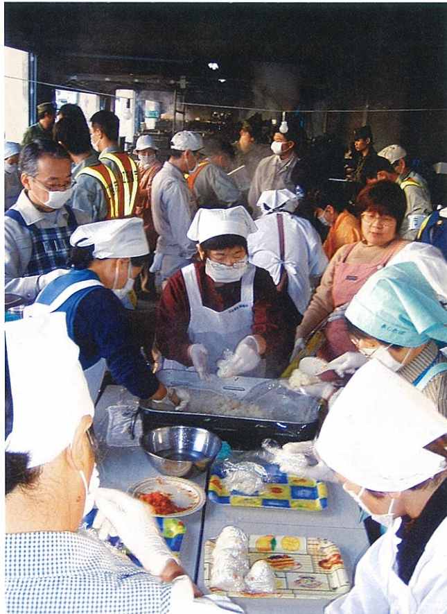
比較的被害の少なかった旧松代町では、社会福祉協議会の呼びかけで小千谷市役所などへ炊き出しのボランティアに向いた