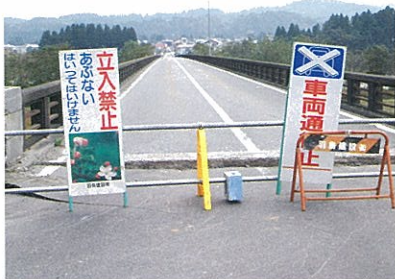
段差ができて一時通行不能になった栄橋