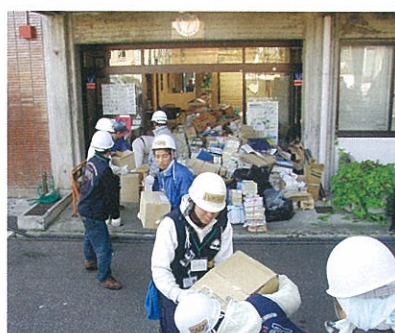
大量の行政資料を運び出すボランティア