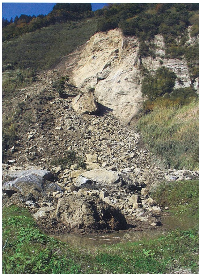
地震の後はいたるところでこのような土砂崩れが見られた