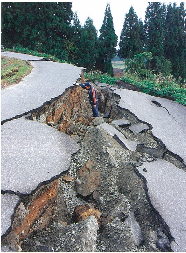
川西ダムに続く町道。地盤の変化で大きく崩壊した