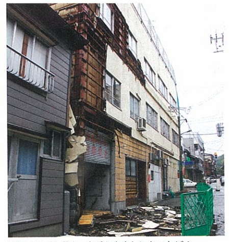
壁板はがれ落ち、中がむき出しになったビル