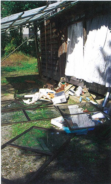
激しい揺れで窓枠がすべて外れ、家の中にあったものが外へ飛び出している