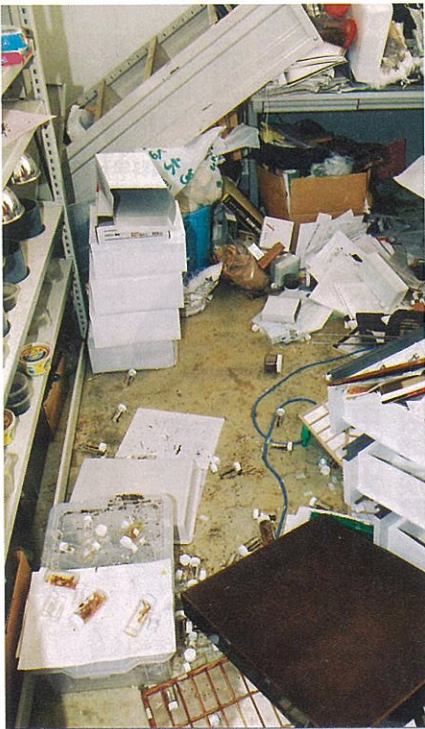
机や棚の中のものまで飛び出した(森の学校キョロ口)