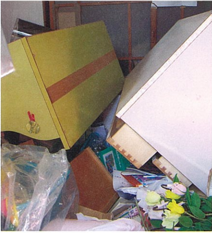
縦・横の激しい揺れに、折り重なるように倒れたたんす