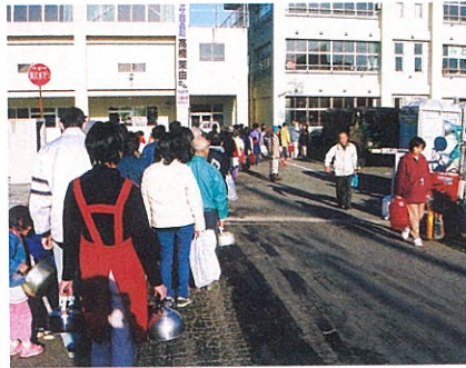
給水車には住民たちの長い列ができた