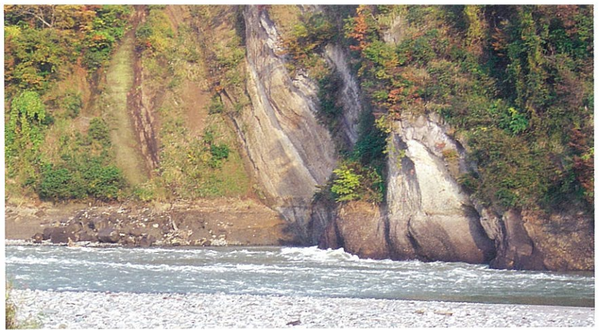
土砂崩れでむき出しになった山肌(手前は清津川)