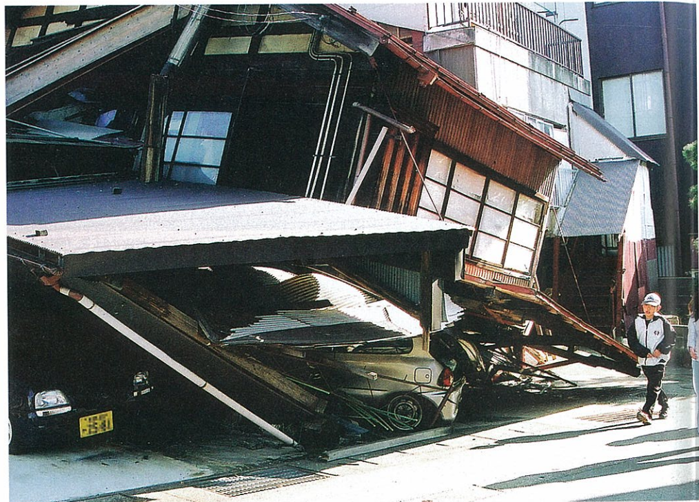
倒壊し、1階部分が完全につぶれた民家