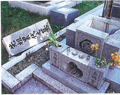
ほとんどの墓石が地震の衝撃で崩れ落ちた