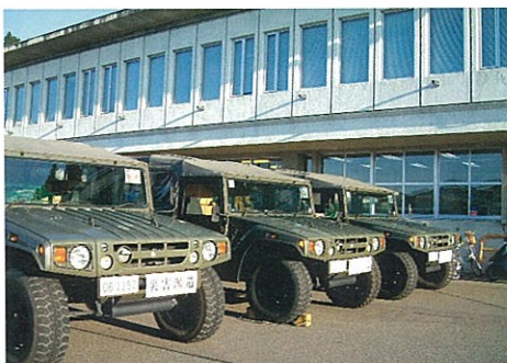
ずらりと並ぶ自衛隊の災害支援車