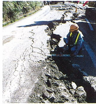
国道253号(池尻地内)に入ったき裂