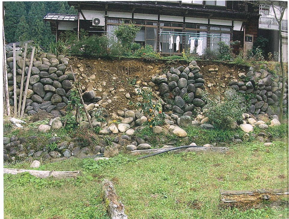
大きな揺れで崩れ落ちた民家の石垣