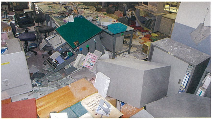
地震から一夜明けた役場事務室の惨状