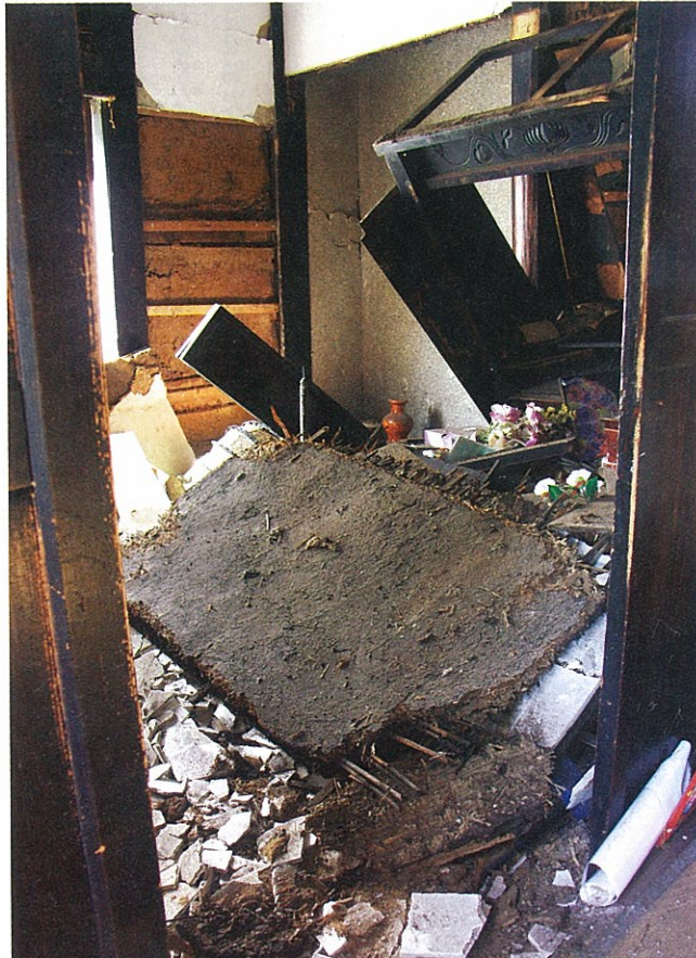
大きな衝撃で土壁が落ち、造り付けの仏壇まで飛び出してしまった民家