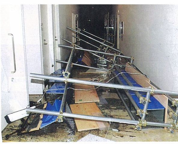
森の学校キョロ口では展示物の水槽が倒れ、大きな被害を受けた