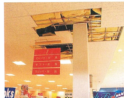
天井板が落下したスーパー