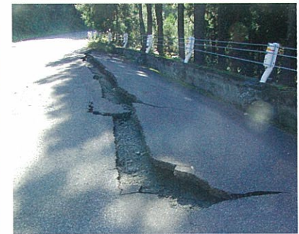
道路のき裂(如来寺)