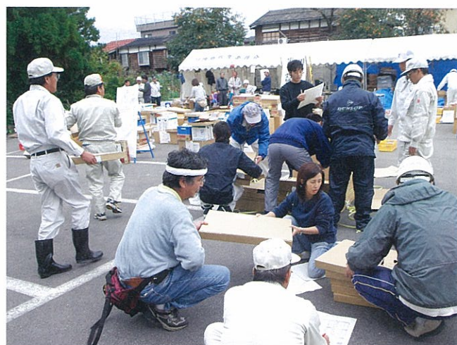
救援物資を集落単位に仕分けする災害対策本部