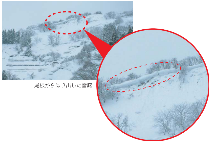
尾根からはり出した雪庇

特徴: はり出した部分が、雪のかたまりとなって斜面に落ちることによって、雪崩につながる危険があります。