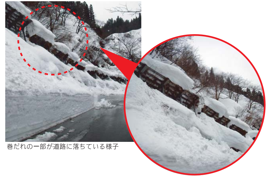
巻だれの一部が道路に落ちている様子

特徴: はり出した部分が、雪のかたまりとなって斜面に落ちることによって、雪崩につながる危険があります。