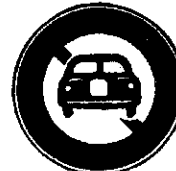
二輪の自動車以外の自動車通行止め