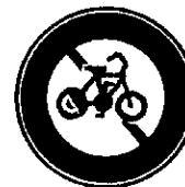
自転車は通ってはいけません