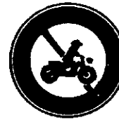
オートバイは通ってはいけません