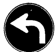
指定方向外進行禁止