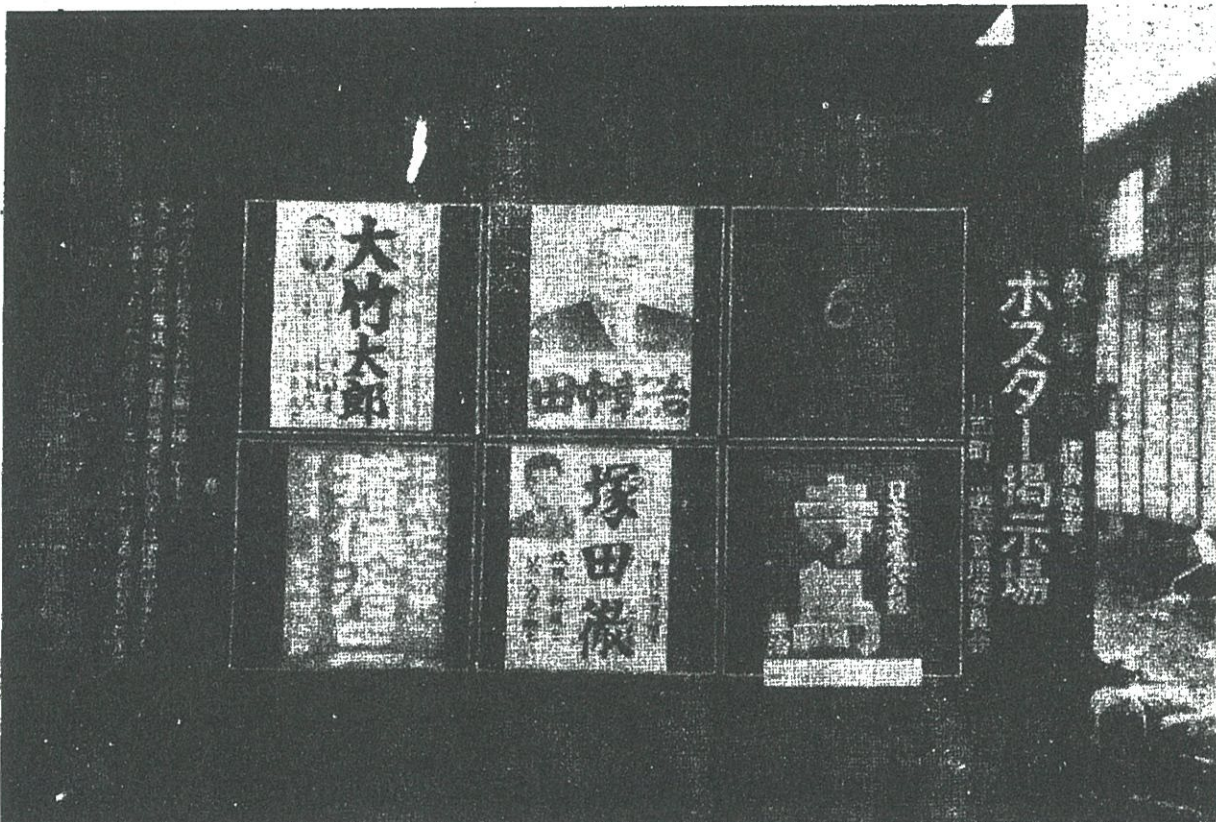
新生活運動写真シリーズ

総選挙もいよいよまぢか、各候補とも活発な選挙活動を展開し、七日の立会演説会このかた熱いムードが流れている。豊かな住みよい社会をきずくため、みんなで公明な選挙を推進しよう。