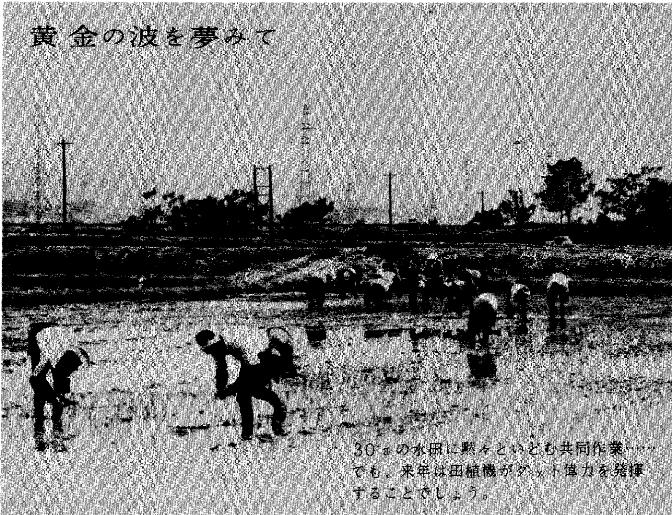
黄金の波を夢みて

30aの水田に黙々といとも共同作業…… でも、来年は田植機がグット偉力を発揮 することでしょう。