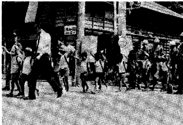
手を上げて横断歩道を渡る よい子たち