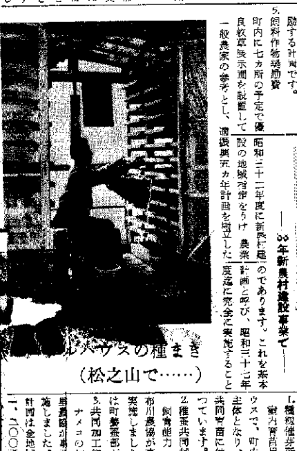
ビニールハウスの様子 (松之山で……)