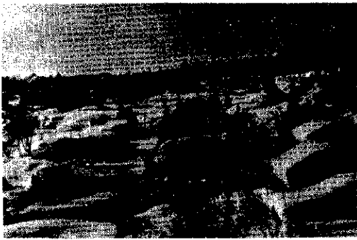
町議会の臨時議会の様子。町長と町議との間で、町長査定案が、町議に提出された。

町の臨時議会は、一月二十三日、町長と町議との間で、町長査定案が、町議に提出された。町長査定案は、町長と町議との間で、町長査定案が、町議に提出された。町長査定案は、町長と町議との間で、町長査定案が、町議に提出された。