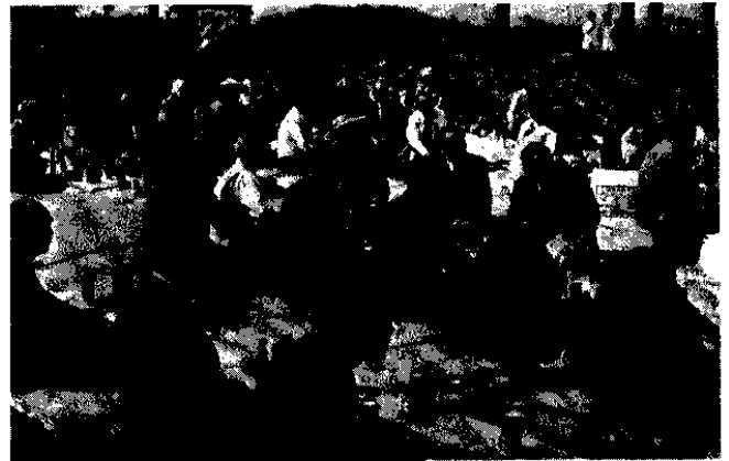
△青空の下で盛大な祝賀会