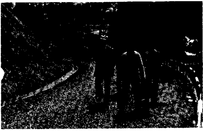
△頂上へ車で行ける新しい道路