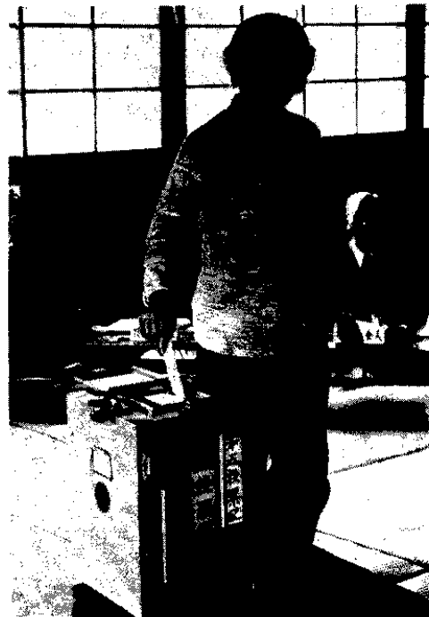
△清き一票を投じる有権者 上川手公会堂