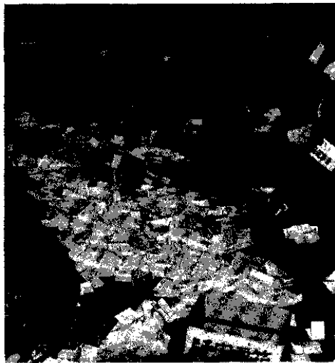
△役場での開票 午後七時半

投票率は八六・四％で、前回（八二・三五％）を四・〇五％上回りましたが、過疎のため投票者数は一六七人減の三、二五四人でした。 第十一投票区（東山冬期分校）では、女子十四人全員が投票し一〇〇％の成績となり、投票所別のトップは第七投票区（中尾集会所）の九三・九四％でした。 （当）君 健男 七二三、八五三票 坂上とみお 四五五、七四〇票 男 八六・六五％ 女 八六・一八％ 計 八六・四〇％ 県の得票数 有効投票数 三、二三二票 無効投票 二二票 投票総数 三、二五四票 投票率