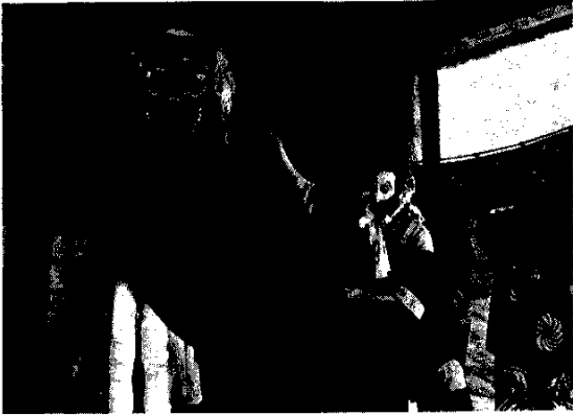
△祝賀会に華を添えた湯山神楽