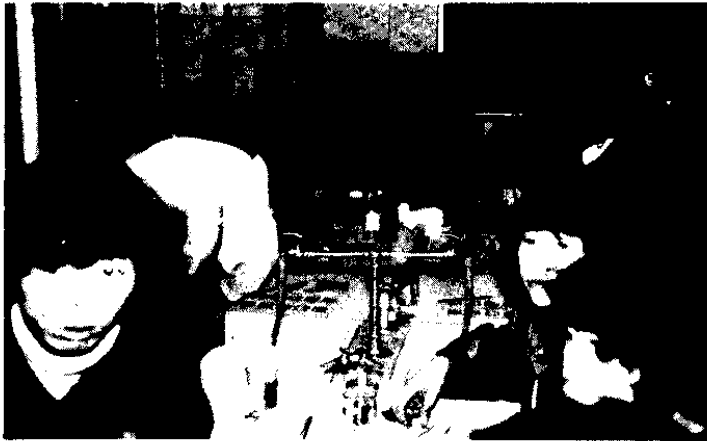
みんな真剣なまなざし

お金をえ出せば、何でも手に入る現代ですが、自分の手で作品を創り出すことも、また違った喜びが……というこ とで、東川分館では、去る二月十八日、婦人会上布川支部との共催により、七宝焼教室が開かれました。