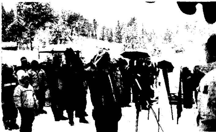
雪にも負けず力強く選手宣誓 (三省地区)