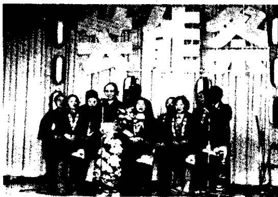
あふれる老人パワー 小谷部落

小谷部落では、祝日の二月十一日新春芸能祭を開催し、部落民総出で楽しい、にぎやかな一日を過ごしました。 この真冬の芸能祭は今年で五回目を数え、年ごとにレパートリーも増えて盛大になつていくと見えています。