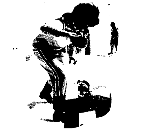
こぼさないように早く、早く (布川地区)

一月十六日、松之山、三省、松里、浦田の四地区で雪上運動会 (スキー大会) が行われました。