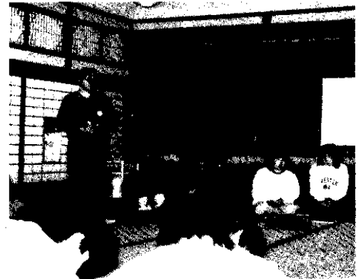
みんなで体験発表しあう