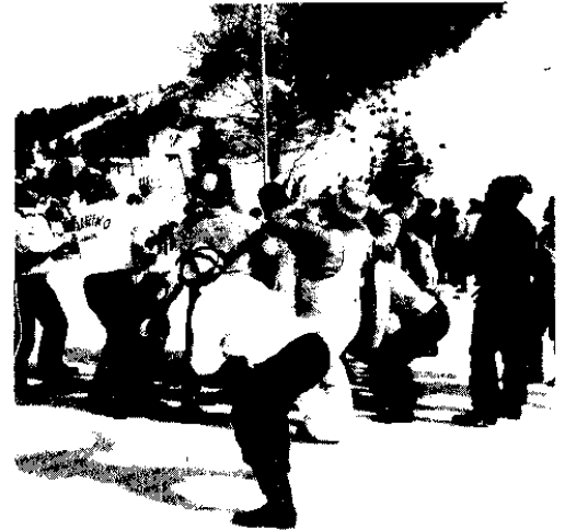
部落対抗玉入れレース (布川地区)