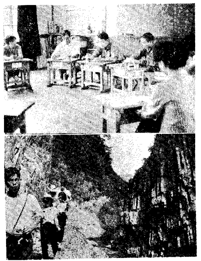
(上) 分科会討論 (下) 楽しい清津峡探勝