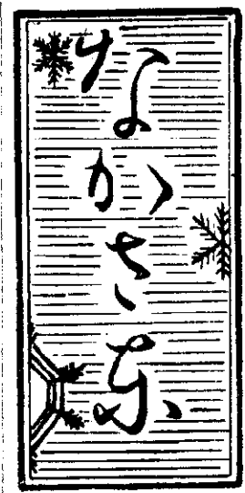
発行所 民衆新聞社 中里村印刷所 十日町新開社

新生活運動は私たちの日常生活の中にある若しみ、なやみ、不便、不満、ふしぎ、不合理などのことをよく考え見つめて現在の生活と理想生活との隔りを縮め、明るく豊かなたのしい生活ができるようにするには、どうしたらよいかを、みんなで話しあひ考えあつて、実践活動をするゆゑに、 新生活運動は私たちの日常生活の中にある若しみ、なやみ、不便、不満、ふしぎ、不合理などのことをよく考え見つめて現在の生活と理想生活との隔りを縮め、明るく豊かなたのしい生活ができるようにするには、どうしたらよいかを、みんなで話しあひ考えあつて、実践活動をするゆゑに、