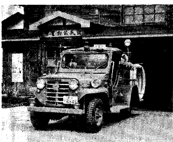
消防自動車新台入 ＝価格165万円＝

兎に角個人々々が確固たる政治的見解を確立し、現実政治や政党に対して毅然たる批判をできる段階になつた時、我々の社会は、もつともつとよい政治が行なわれることになるだろう。社会教育機関としての公