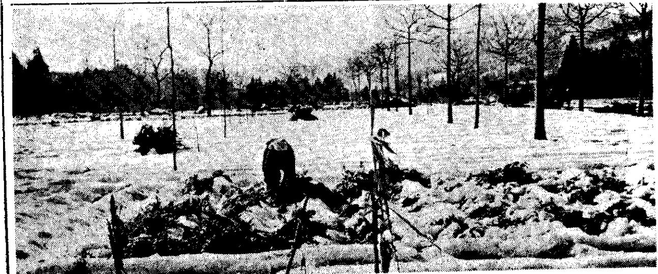
<か◇く◇て◇冬◇来◇る◇> 雪の下から大根取り (干溝地内)