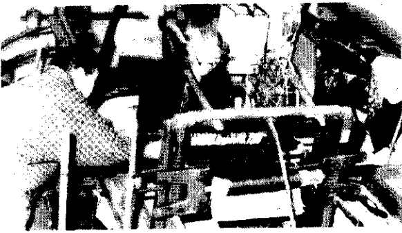
写真上は資料室に展示されたいざり機

▽使用料は特別に認められた場合に限り、 村内の資料(文化財)を整理して、 村の昔の生活を考えよう。資料の収集に御協力を