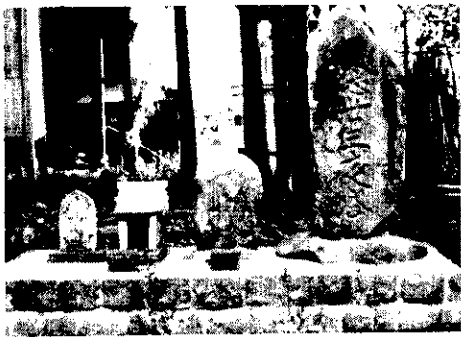
左は村内の石仏群