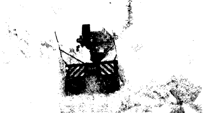
冬はたよりになるねえー