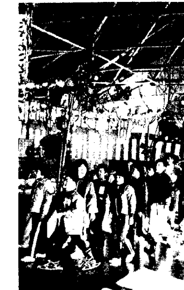
昔の子供たちってこんなふうだったのか

子供たちは、昔の子供たちのように、ミノ、カサ、カンジキ、ワラゲツを身につけ、鳥追いの歌ともぐらもちの歌を歌いながら、会場に設けられた舞台の回りを歩きました。