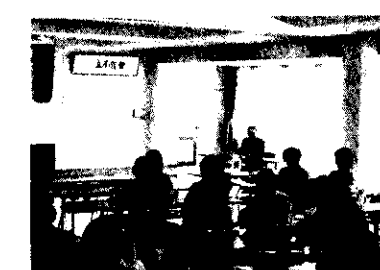
そやんの一と考える人たち

十一月十二日、公民館主催による家庭教育講座が、小学校入学者の子供をもつ母親を対象に、総合センターで行われました。