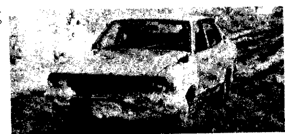
あー スピードをゆるめて

アツスピードを落して!! 私たちがの中で、雪水のはねあげによる被害に、一度も会ったことのない人はいないでしょう。山崎の中心街では、傘は上にさすのではなく、横にさし車の雪水のはねあげから自分を守っています。車を運転するときは、歩行者に迷惑をかけるないように、静かに走りましょう。スピードを落して通過してくれる運転手は、なぜかとても良い人に感じられるものです。