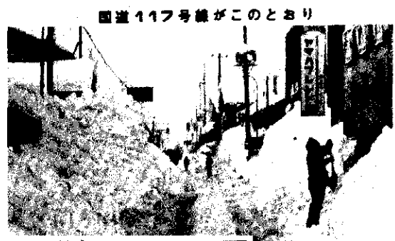
国道117号線がこのとおり

記録的な豪雪 今年の冬は、昭和二十年以来の記録的な豪雪に見舞われ各地に大きな被害がでました。村でも、一月七日に雪害対策本部を設置し、豪雪に対処しました。清津峡小土倉分校の観測では、一月十三日にこの冬最高は、一月十一日には、県の災害救助条例が適用になり、その後十四日から二十一日までの間災害救助法が適用され、村内に住む一人暮らし老人等四