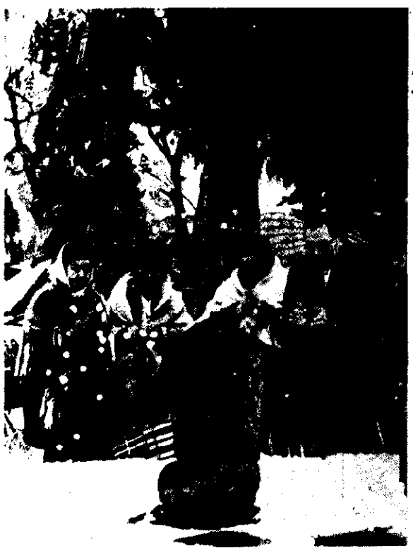
どうらく神に今年の無事を祈る

(その三) オラがうらのわせだの稲を なに鳥がまくらった すずめ鳥がまくらった すずめ、しゅわ鳥 たちやがれ ホーイ ホーイ (その四) アリアララが鳥追い コリヤララが鳥追い だいろうとんの鳥追いだ 頭切つて、尻切つて ほんだわらへほうりこんで 清津こうのおばこの へその下へ ホーイ ホーイ (モグラモチ追い歌) モオグラモチやどけどけ お稲どんのお通りだ