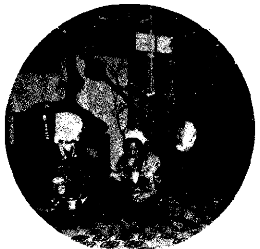
作飾りの下で製作業のまねをする