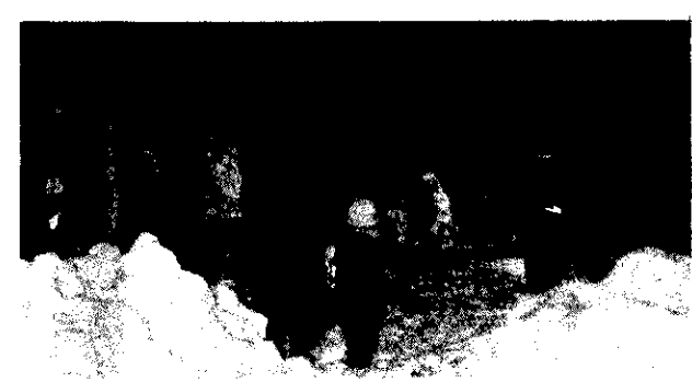
この火にあたるとマメになる(雪洞)