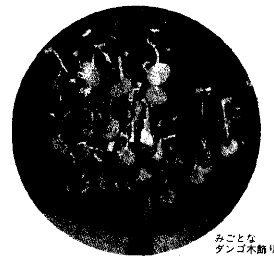
みことな ダンゴ木飾り