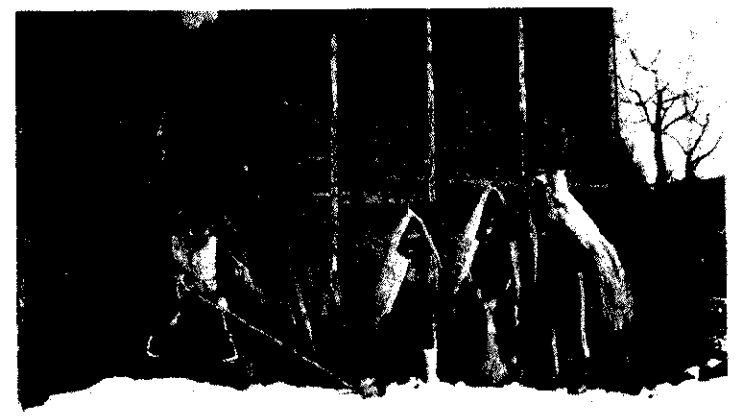
昔よく行われたモグラモチ追い