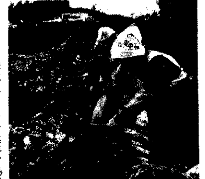
大根の出荷(小松原)

など農村を取り巻く情勢はなかなか厳しいものがありますが、お互いに補い合つて楽しい生活ができるように努力していきたいと念じております。 今年も村民皆さまにとつてより明るい佳年でありまうお祈りいたします。