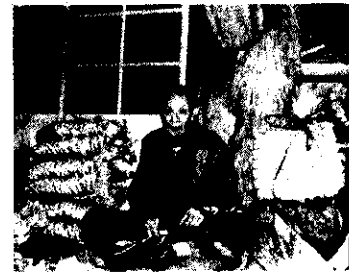
こうしての一作らんだ

今年も、ワラジの仕入先の三条望月商店の人が来られて十二月十三日老人福祉センターでワラジの講習会が行われました。