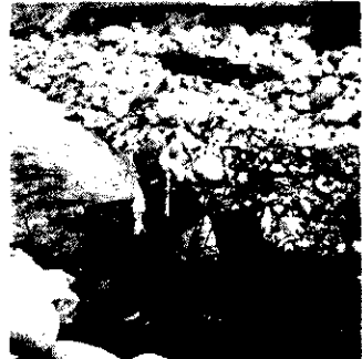
清津川へ直行の傷ついたオスサケ

この水路に入ってきたということは、ここで育ったサケにまちがいないと思う。と喜んでいました。同漁協では、これまでに百七十万匹のサケの稚魚を放流しています。放流された稚魚は、約一カ月で海へ下り、そこで海水の温度が十五度になるまで滞在し(一カ月〜二カ月)北洋への回遊に備えて大きくなります。十五度をこえたと一斉に北洋への回遊に出て、三〜四年して生れ育った川に卵を産みこぼしてきます。サケは生れ育った川を見つめるために河口近くを波状を描きながら(浮・沈)泳ぎ河口の水のおおいをかいで生れた川を見つけるといわれています。