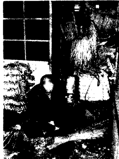
ワラをたたいてしなっくしらんぞー

生指導では、婦人の健康づくりと、家族の健康管理についての知識向上を図る予定です。 「新潟県史刊行の二案内」新潟県が「立県百年」の記念事業として、かねて編纂を進めてきた「新潟県史」は、昨年度に続いて、五十八年三月末に五巻が刊行されることになりました。 刊行予定の五巻は、貴重を未公開史料を多数紹介しており、新潟県の歴史を知る上で不可欠の資料集です。 ◆今回刊行巻の内容 ○資料編1 原始古代1 考古編 五、五〇〇円 ○資料編4 中世1 文書編 四、九五〇円 ○資料編11 近世六 文化編 四、九〇〇円 ○資料編14 近代1 明治維新編 四、九〇〇円 ○資料編19 近代七 社会文化編 四、九五〇円 なお、既刊の十一巻(原始古代2、中世1、近世1、近世2、近世3、近代1、近代2、近代3、近代4、近代5、近代6、近代7)もまだ在庫があります。 ▲申込先 〒951新潟市学校町通一番町六〇二番地 新潟県総務部 県史編さん室(〇二五二一) 一三二一五五五