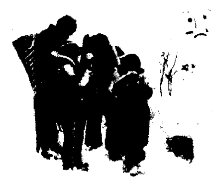
雪で作ったどうらく神様

(その三) オラがうらのわせだの稲を なに鳥がまくらった すずめ鳥がまくらった すずめ、しゅわ鳥 たちやがれ ホーイ ホーイ (その四) アリアララが鳥追い コリヤララが鳥追い だいろうとんの鳥追いだ 頭切つて、尻切つて ほんだわらへほうりこんで 清津こうのおばこの へその下へ ホーイ ホーイ (モグラモチ追い歌) モオグラモチやどけどけ お稲どんのお通りだ