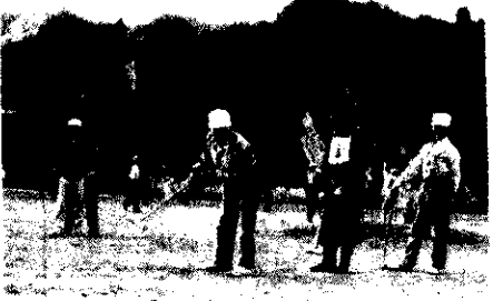
交通安全ゲートボール大会

新年あけましておめでとうございます。今回は、上村村長の新春のあいさつと村内で活躍されている四人の方に今年の抱負を語っていただきました。今年も交年です。皆さまの目標に向かって奮闘を期待します。