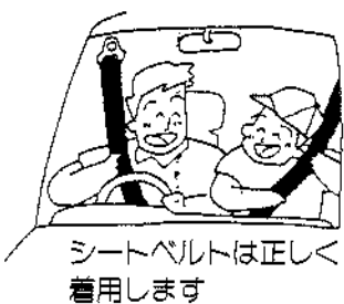
シートベルトは正しく着用します