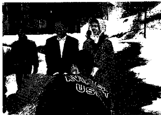
角間での収録風景