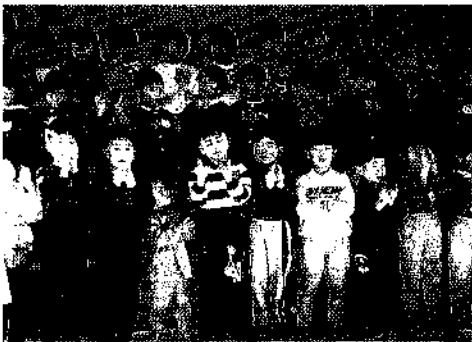
難しい手話も楽しく覚えました