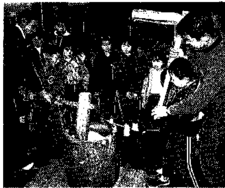
父兄から手伝ってもらって「よいしょ」

ついたもちは早速、あんこもちやきな粉もち、ぞう煮などに料理され、参加者のおなかを満たしていました。