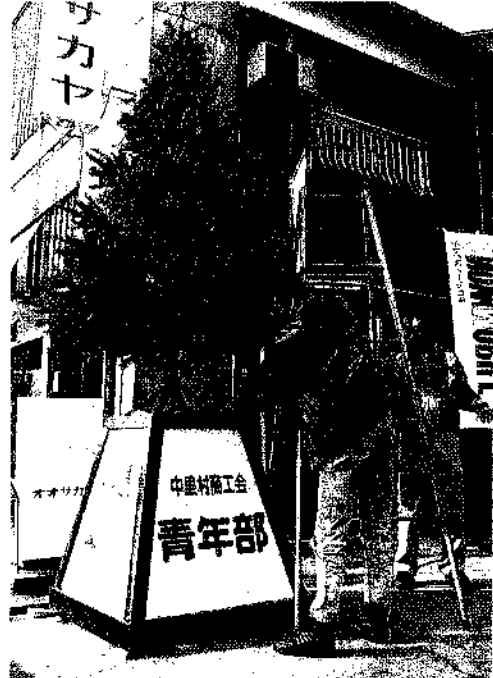
ツリーを設置する商工会青年部員