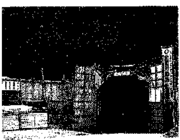
歩道トンネル完成後は通年観光も可能となる清津峡

【条例関係】 議会の議員の報酬及び費用弁償等に関する条例の一部改正——期末手当の算出乗率が引き下げられました。 職員給与に関する条例の一部改正——人事院勧告により