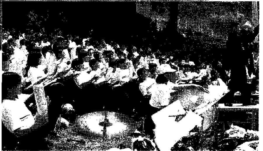
応援にも熱がはいります