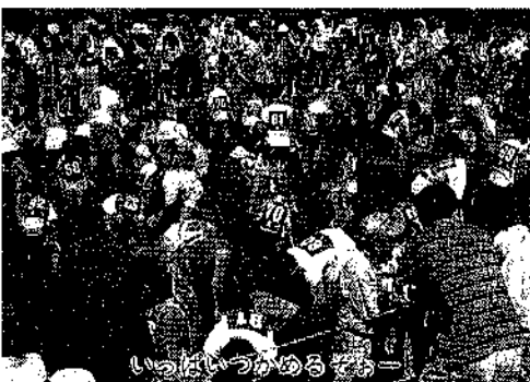
いつにいつかあるぞ〜