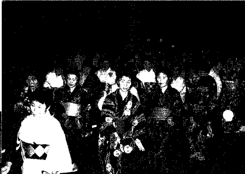
▶浴衣姿で民謡流し…

〒949-84 中里村大字田原2-1-18 電話 0110-257(63)3111 FAX 0110-257(63)2044