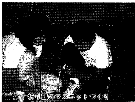
折り鶴のマスコットづくり

また、長年この運動を続けてきたことで十九日(月)には、六年生に十日町警察署長並びに中里村交通安全協会より感謝状と記念品が送られました。