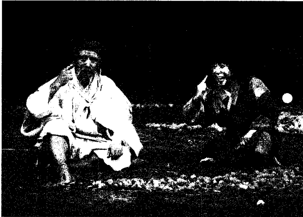
第一幕一場「石つぶてのなかの泥かぶら」より

▶編集発行/中里村総務課 〒949-84中里村大字田沢己2133番地 ☎0257(83)3111 ☎0257(83)2044