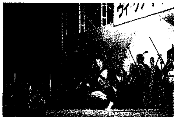
▲雪原カーニバル'95は最高でした。更に'96は……