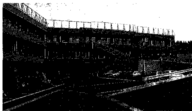
▲高齢者福祉サービスの拠点として期待される特別養護老人ホーム「七川荘」

今回は、平成11年4月までの予算運営がどのような状況になっているかを図表にしてみました。