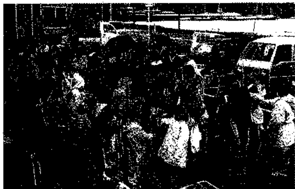
▶最初はゲー、ジャンケンポン

また、ゆくら玄関前では豪華賞品の当たるジャンケン大会なども行なわれたり、おいしい甘酒やおしるこがふるまわれたりと、集まった人たちは楽しい小正月の一日を過ごしていました。