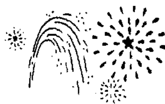
メモリー花火打ち上げ