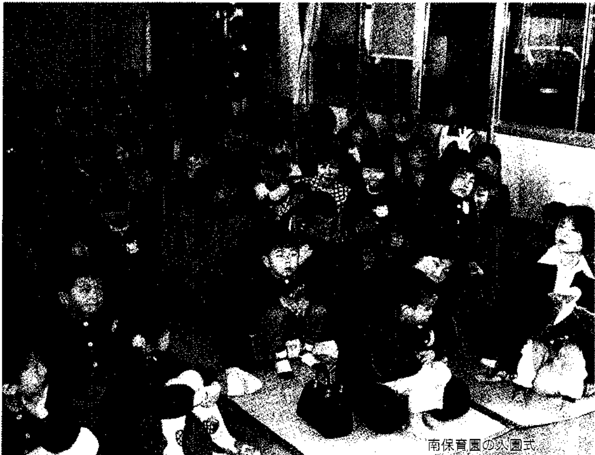
南保育園の入園式

〒402-8502 静岡県清水市赤石133番地 TEL:0527(66)3111 FAX:0527(66)2044