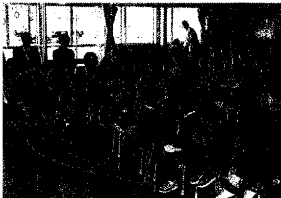
▶中里保育園の入園式

式の終わりに、中里保育園ではパネルシアター、南保育園では手遊び、エプロンシアターなどを行ない、園内に楽しそうな園児たちの声が響き渡っていました。