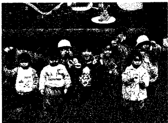
▶あけびもあつたよ

この日は朝から曇り空の肌寒い天気でしたが、昼食の時間になる頃には青空も広がり、太陽も顔を出し始めました。遊歩道を散策してお腹のすいた園児たちは、芝生の広場でお母さんから作ってもらった豪華な弁当をひろげ「外で食べるととっても美味しいね」とみんなで楽しそうに大きな口をあけて食べていました。