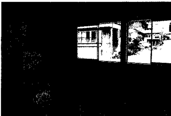
▶自然の光が入るように

皆さんがいつまでも気持ちよく利用できるように、マナーを守り、いつまでもきれいな状態であるように心掛けましょう。