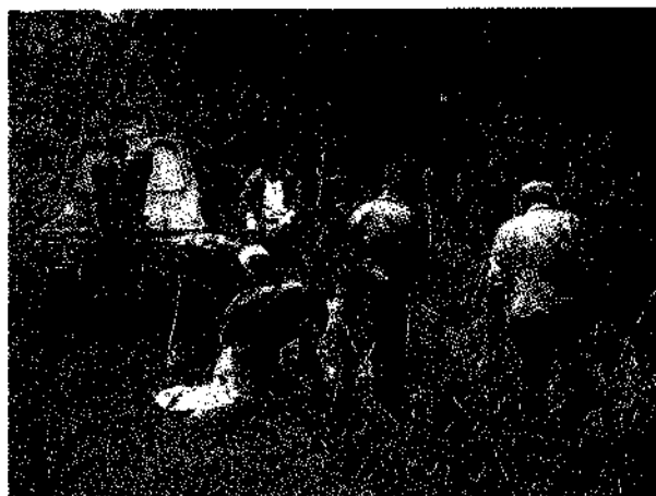
村内不法投棄(カントリークラブ)の様子