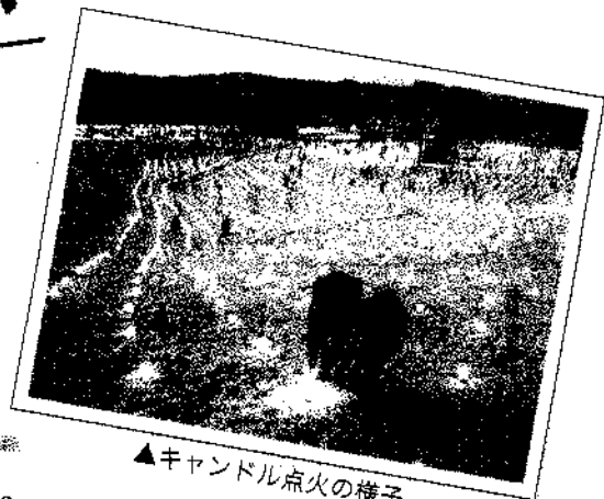
▲キャンドル点火の様子