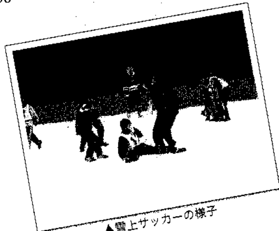
▲雪上サッカーの様子