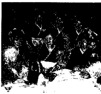
5月3日(月) 中里村成人式