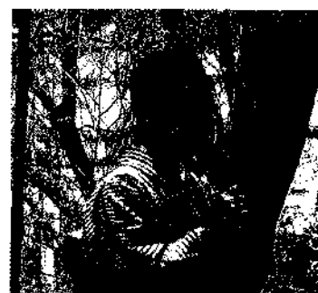
4月29日(木) 黄桜の丘桜祭り