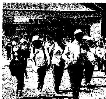
4月29日(木) 信濃川河岸段丘ウォーク

ご家族・お友達を誘ってお出かけしてみたいか がてしょうか? 大勢のみなさんのご参加・ご来場 をお待ちしています!