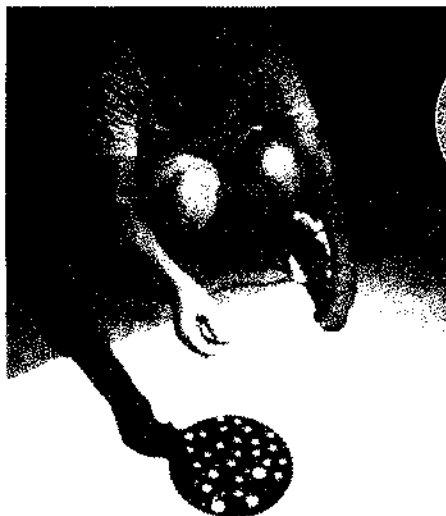
▲星の木もれ陽…どうして??