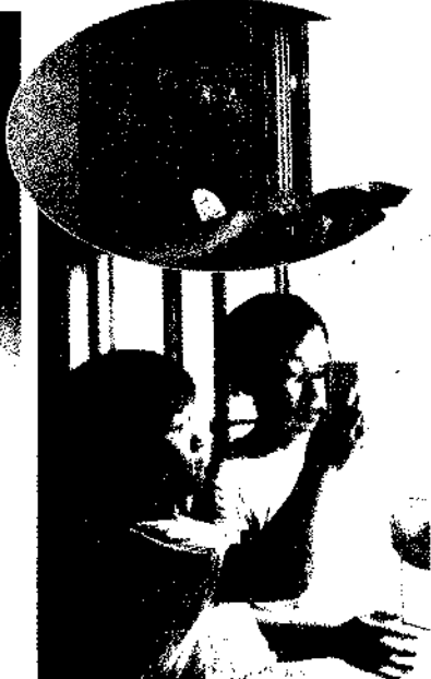
▲風景が映っているよ