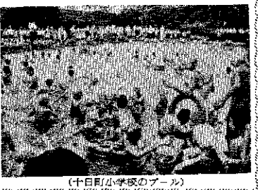
(十日町小学校のプール)

子どもたちの活動の様子。子どもたちは、プールで楽しんでいます。子どもたちの健康と安全を確保することは、学校にとって最も重要な任務です。