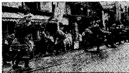
人気を呼んだ夏まつり行事の呼びもの飯盛黒田。市内の店主二十人が、美しいヨロイ姿で黒田飯盛を披露した。

予約米の受付が開始された。これは、米の確保と価格の安定を図るための措置である。予約米の受付は、市民の利便性を高めるための重要な取り組みである。