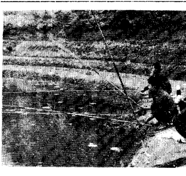
保健所で行われている集団検診の様子が写っている。

保健所では、集団検診の強化を図る。特に、高齢者や慢性病患者を対象とした検診を実施する。検診内容は、血圧測定、血糖測定、聴診、視力検査などである。また、検診結果に基づいた健康指導や薬物療法の実施も行う。市民は、積極的に検診に参加し、健康状態を把握するよう努めるべきである。