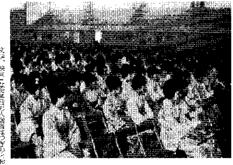
新潟国体大会旗、十日町を通過