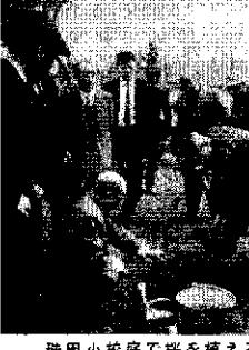
珠田小坂庭で花を植える塚田知事

人口の増加は、市の発展と密接に関連している。人口五万を突破したことは、市の発展と密接に関連している。