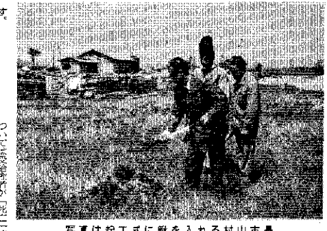
写真は起工式に敷きを入れる村山市長

死亡一時金の支給は、四月一日から開始されます。これは、市民の生活を支える重要な施策です。