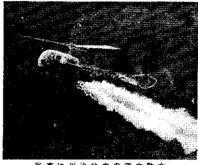
写真は川治地内の空中散布

能率散布は、農作物の病害虫防除に効果的である。四一町歩に空中散布が行われ、農作物の被害を軽減した。この散布は、農作物の健康を維持し、収穫量を確保するために重要な役割を果たしている。