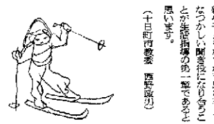
スキーを楽しむ人々

生活指導は、子どもの成長に役立つ。これは、生活指導である。 ①生活指導 ②生活指導の注意