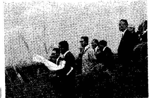
①東側 自然の立地条件から導入可能 とされる果樹は、くる み等があげられる。②高貴地 帯におけるくり栽培について は、十日町市に前例があり充 分導入可能性をもつ。 ③タバコ 昭和四十年の 百四十六ヘクタ 爾の傾向を示 す。④ブドウ 当り収量は八 万七千円と県 平均に近い。 ⑤ホップ 昭和四十年二 十一ヘクタの 収量がある。品質 は好成績があ る。⑥近年急 激に増加され ている。 ⑦養蚕 古くからの産 物。

開拓構想 この事業は開拓 による農用地造成 一万三千ヘクタール よび、用水供給、 地目変更開田二千 ヘクタールの改良業 を合わせた総合開 拓のハイレット事 業であり、一万三 千三百ヘクタール (開田千八百四十 ヘクタール、開田 六千四百六十ヘ クタール)の改良 地を改良するもの で、改良の基本的 考えは水田を主体 とし、アルペン農 業による経営規模 拡大と豊かな農村 社会の建設をはか る。