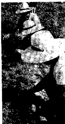
奉仕活動を続ける老人クラブの補助にあてられました