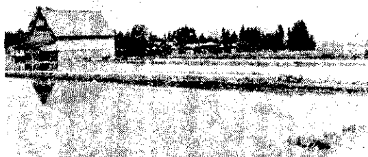
農振地域に指定されると、農業の生産基盤を整備し、農業の近代化をはかる。

農振法の目的は、最近、都市周辺部への人口集中や交通機関の整備で農地の虫食い化が現れましたが、この現象を防ぎ(一)都市化を図る地域と農業の振興を図る地域(農業地域)とを区分し、農振地域に農業投資を集中して行ない、農業の健全な発展