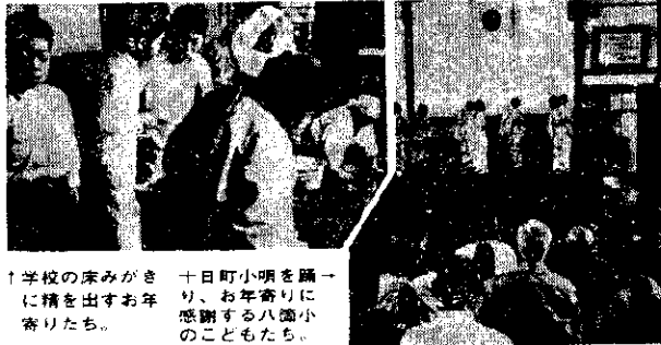
十日町八箇小の孫親教室の様子。お年寄りが子どもたちに、お年寄りの生活や、お年寄りの心遣いなどを話している様子。

去る五月十七日、十八日の二日間、八箇小(竹内校長、児童三十六名)で、お年寄りとともに「孫親教室」が開かれました。