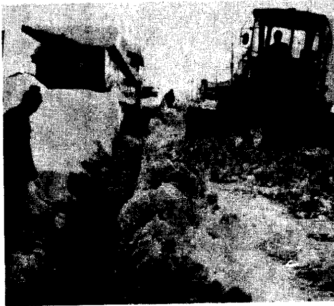
市役所除雪隊——車道と歩道が分離している道路では、車道のほか、歩道の除雪にも大活躍——。