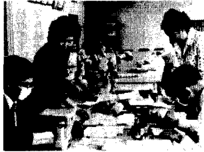
試し買い商品の量目が適正か真剣に計量された

市及び県計量検定所は、計量思想普及推進強化月間の行事として、去る六月十日、商工会議所で、主婦十五名を招き、消費