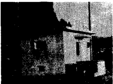
51年完成の下水道地区簡易水道ポンプ操作室

昭和五十年四月一日以降、戦没者の遺族に対し特別弔慰金(二十万円)記名国債(十年償還)が支給されることになり、その請求をされた方から、まだ、国庫債券が送られてこない等の問い合わせが多く寄せられています。そこで、市社会福祉事務所、調査したところ、県では、支給対象者が多く、請求事務が大幅に遅れている状況で、請求書を県へ提出して、おおよそ一年半くらい経過しないと国庫債券が手元にお届けできないとのことでした。ご了承をお願いします。