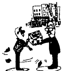
政治家や候補者からの飲食物やお金などの提供は法律で禁止されています。