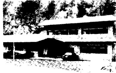
↑老人福祉センター「羽根川荘」 ↓武道館

当市の国民年金加入者は一万四千六百六十二人、年金受給者は、拠出・福祉あわせて七千二百七十四人です。この人達に支払われる年金額は約十八億円の巨額にのぼっています。 みなさんが納入れた保険料の積立金は、年金給付のほか厚生施設や生活環境施設の建設等にも役立てられています。 昭和五十五年度には、老人福祉センター「羽根川荘」、武道館、簡易水道事業(名ヶ山地区、轟木地区、新水地区、北原地区、下条地区)が国民年金の還元融資を受けて建設されました。 国民年金は、年金の支給ばかりでなく社会を住みやすくするために、大いに役立っています。