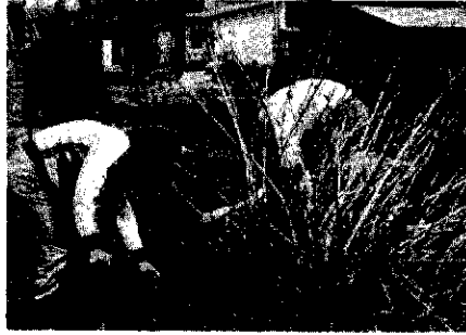
家庭の庭から株分け(上新田)

八箇地区で、あじさい公園の造成が進められています。この公園造成は、一昨年の庚申の年にちなみ、地域の青壮年を中心に、何か後世に残る事業をしようとした結果、地区民をはじめ市民の憩いの場として公園を造成しようとはじめられたもので、造成場所は、八箇小学校に隣接する約三畝です。