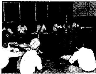
懇談会打合せ風景(新座地区にて)